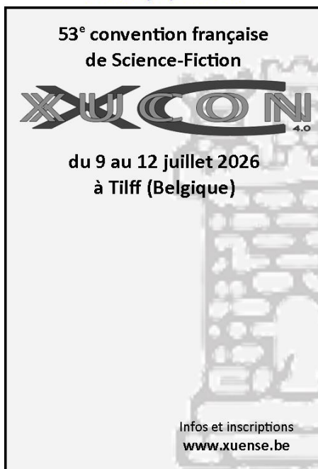
Version flyer / affichette